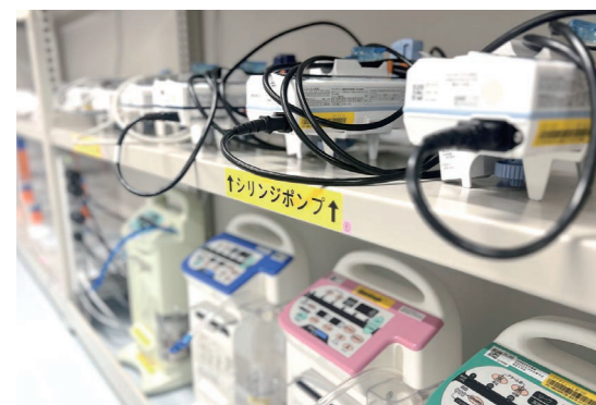
整備された医療機器

や管理を一括して行っています。2024年4月からは手術室にも臨床工学技士の専任配置を行いました。新たな業務は勿論、医療安全や災害医療、呼吸療法など様々な分野で専門的な知識を活かし、多職種と連携しながらチームで力を発揮しています。