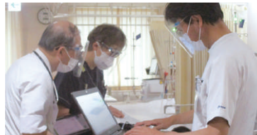
医師による透析回診

定期的に採血データ、胸部レントゲン、心電図検査を行い患者さんへの説明・指導・透析条件の設定を行っています。