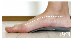
インソールで補正した状態