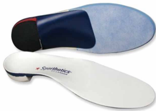
▲インソール（中敷き）