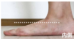
内側のアーチが低下した状態