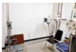
▲胸腹部レントゲン検査室