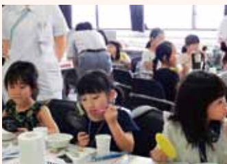
▲正しい歯の磨き方