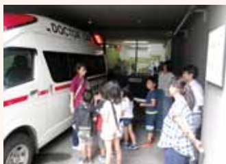
▲ドクターカーに試乗