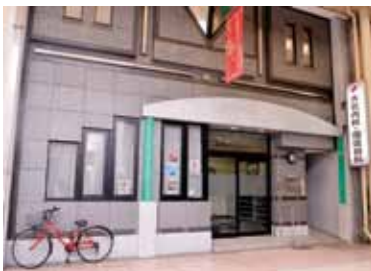
▲商店街の中にある病院