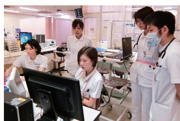
スタッフ一同で情報共有

ICU・HCUには救急搬送された心肺停止蘇生後、急性心筋梗塞、外傷の患者さんや、内科・外科・脳神経外科などさまざまな患者さんの集中治療管理をおこなっています。