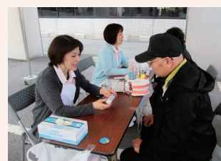
▲歯科相談コーナー