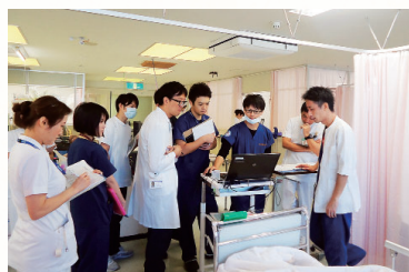
他科医師によるカンファ