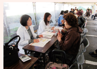
▲栄養相談コーナー