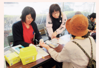
▲健康チェックコーナー