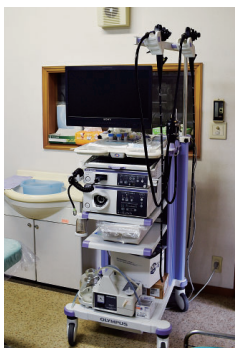
▲高解像度カメラの内視鏡検査機器