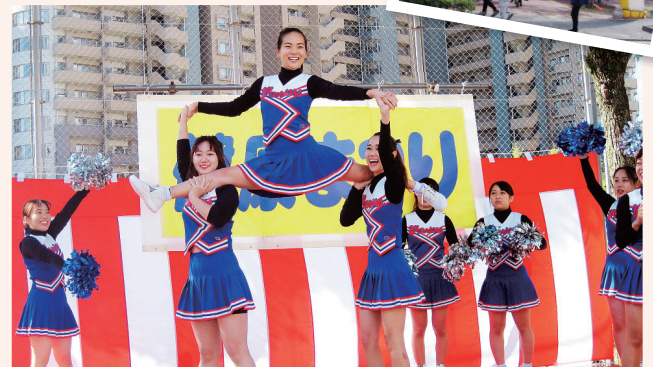
▲北九大チアリーダー部によるオープニング