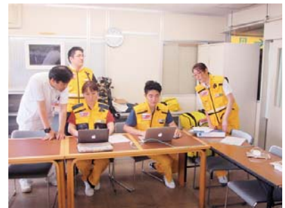
他病院からのDMAT隊員支援 受け入れ訓練