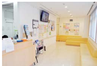
▲患者さんの交流が生まれる待合室

私は今年4月から父を引き継いで院長となりました。当院は父の代からこの地で30年以上診療を行っていて、かかりつけの患者さんも高齢化しています。そういった方たちが住みなれた地域で安心して生活していけるよう、医療・福祉の面からサポートしていきたいと思っています。