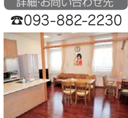
共有のダイニングスペース