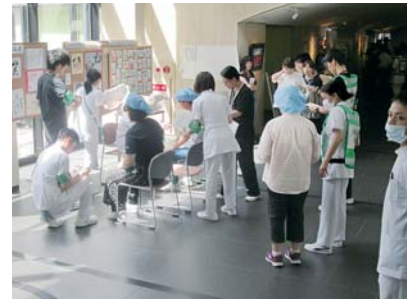
救急車以外の来院傷病者は正面玄関 関入口で受け入れトリアージ（重 傷度選別）訓練