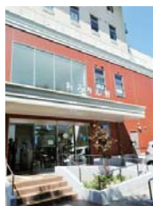
池園医院の裏側が入口