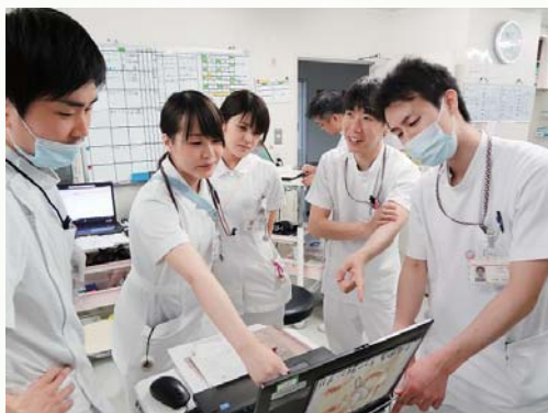
カンファレンスの様子

また、泌尿器科は尿路結石や尿路感染・腎盂腎炎の患者さんを中心に手術も多く、特に近隣ではほとんどないESWL（体外衝撃波結石破碎治療）を取り扱っていることも特色の一つです。