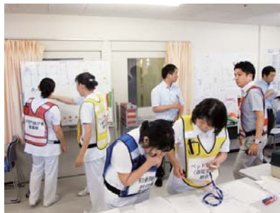
入院ベッドの確保訓練