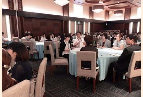
セミナー終了後に懇親会