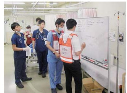
事務リーダーによる患者情報の記 入訓練