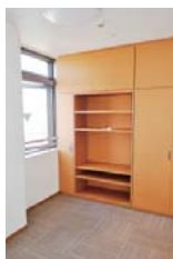
大きな収納を備えた居室