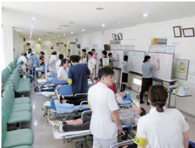
トリアージした中傷度患者の外来前 救急車での受け入れ訓練 に設置したベッドでの処置訓練