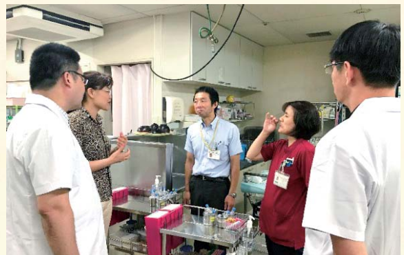
▲救急センターを見学する視察団