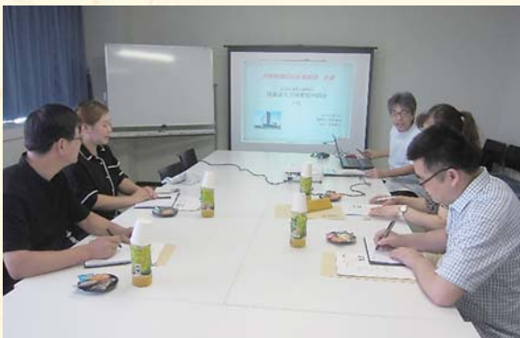
▲通訳を介しながらの説明なので、 ゆっくり丁寧に病院概要を紹介する西中院長