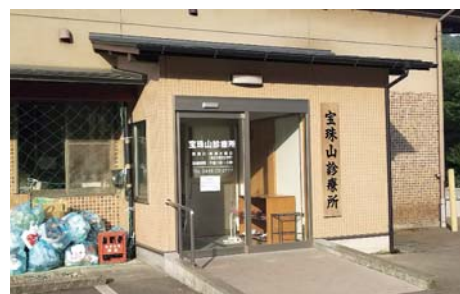
▲保健福祉センターいずみ館付属の診療所