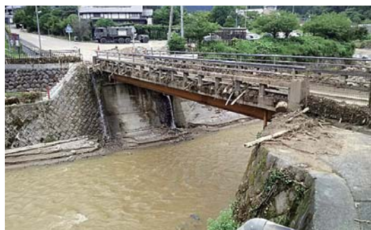
▲橋の高欄に流木が引っ掛かっている 水位が橋の上までであったことがわかる