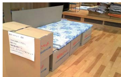
▲避難所で支給されていた段ボールベッド