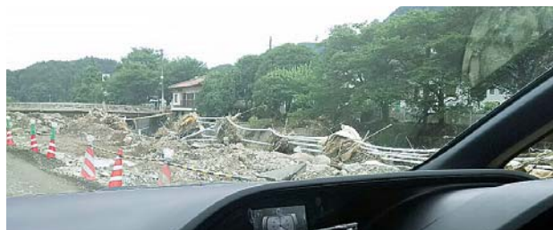
▲車窓から 東峰村の道路