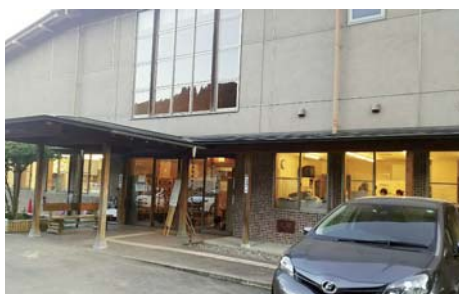
▲保健福祉センターいずみ館