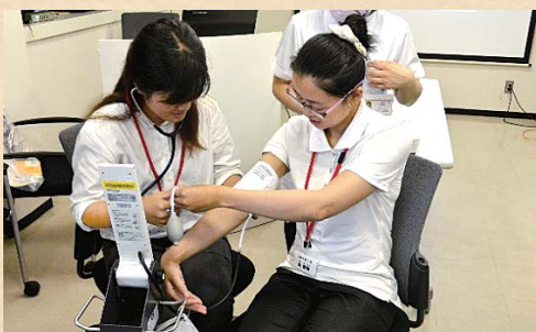
▲ バイタルサイン測定実技演習