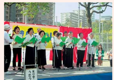
▲友の会うたごえサークル