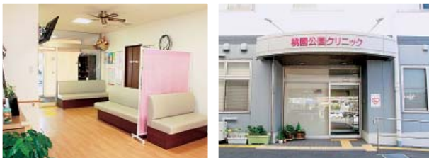
▲すっきりとして清潔感のある待合室と入口

〒805-0068 北九州市八幡東区桃園1丁目5-1 TEL 093-671-1119・FAX 093-671-1115