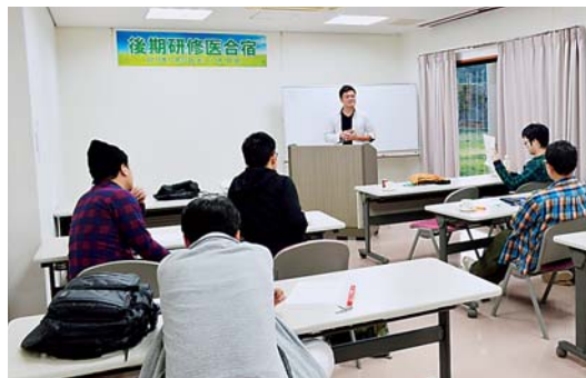
ディスカッション