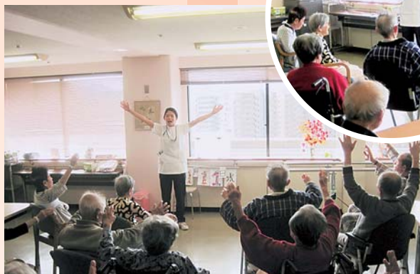
▲デイルームを使つての集団リハビリ