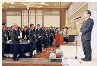
▲宇野小倉医師会会長による来賓挨拶