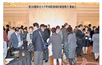
▲会場いっばいで賑わう懇親会